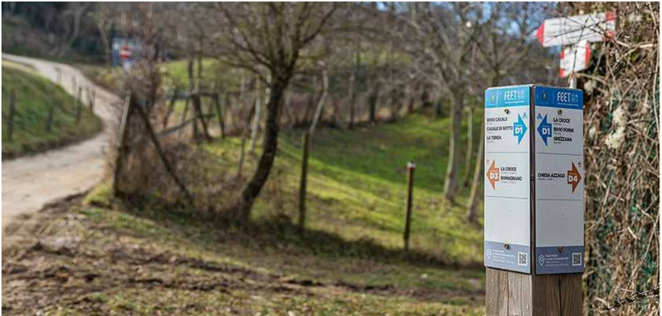
Un particolare di uno dei sentieri "Feet"

Il Comune di Grezzana si appresta a dare il via alle nuove escursioni del progetto FEET, l'iniziativa che punta a promuovere in modo ecologico e sostenibile il territorio locale, valorizzando le sue caratteristiche uniche.