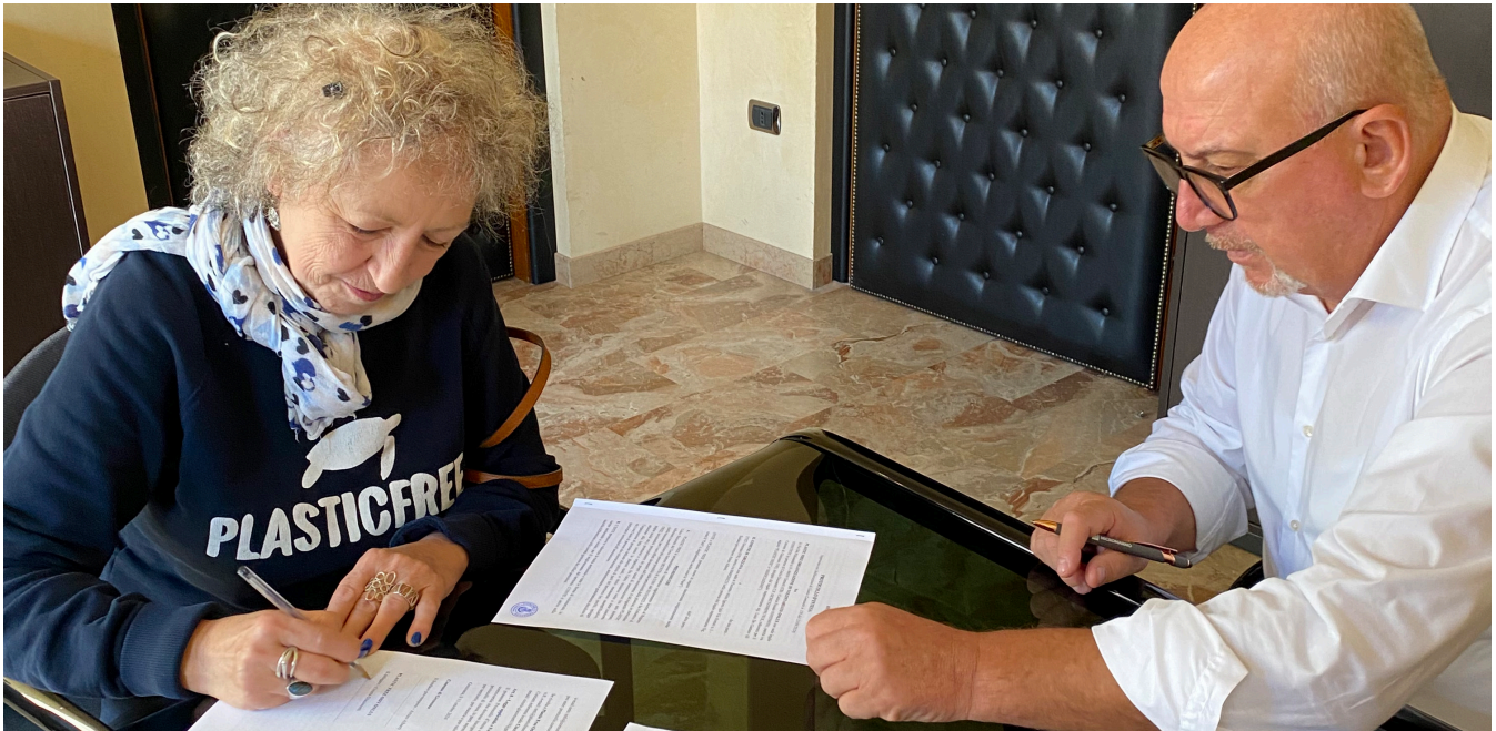
Il rinnovo della firma del Protocollo d'Intesa con l'Associazione Plastic Free

È stata rinnovata la firma del Protocollo d'Intesa tra il Comune di Grezzana e l'associazione di volontariato Plastic Free Onlus che ha l'obiettivo di informare e sensibilizzare più persone possibili sulla pericolosità della plastica, soprattutto quella monouso.