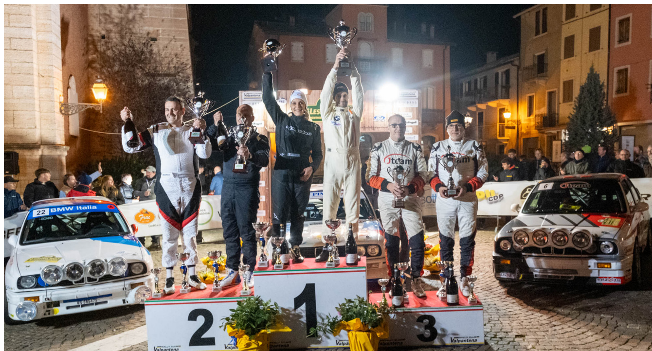
Il podio del 6° Lessinia Rally Historic

Si è svolta, durante il weekend dell'8-9 novembre, la sesta, attesissima, edizione del Lessinia Rally Historic, l'evento più importante della stagione per gli appassionati veronesi di rally storici organizzato dal Rally Club Valpantena.